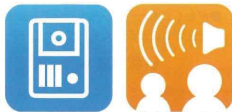
写真4 特許出願中の「ピンポン」(左)と「いっせいボイス」(右) アプリのアイコン。シンプルだが、かわいらしいデザインだ。

アプリの強みは拡張性があることが挙げられます。将来的に各設備との連携なども検討しています。また、デザインなどもデベロッパーごとのカスタマイズや、ユーザー画面のデザインを選択できる機能なども追加可能なんです。分譲マンションのリニューアルを想定して開発しましたが、新築であっても、もちろん導入可能なので選択肢の1つとして提案を強化も予定しています。電気設備の更新のニーズは増加が見込まれるので、隠れているウオッツも狙って拡大を図りたいですね」