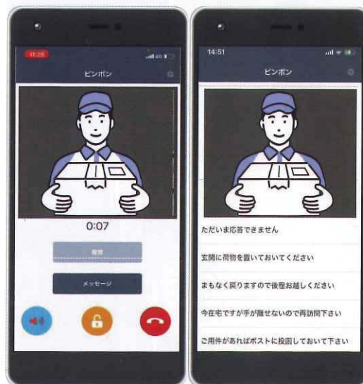
写真2 子機(住人のスマホ、もしくはタブレット)の表示イメージ。

櫻井「実環境におけるテストをスタートして約4カ月が経過するなかで、集合玄関に設けた親機として使用するタブレットのアプリ画面を落してしまうトラブルはあったものの、通信関係やアプリ自体のトラブルは発生していません。この問題はインターホン画面をロックすることで解決しています」